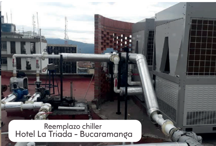
Reemplazo chiller Hotel La Triada - Bucaramanga