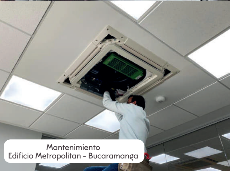
Mantenimiento Edificio Metropolitan - Bucaramanga