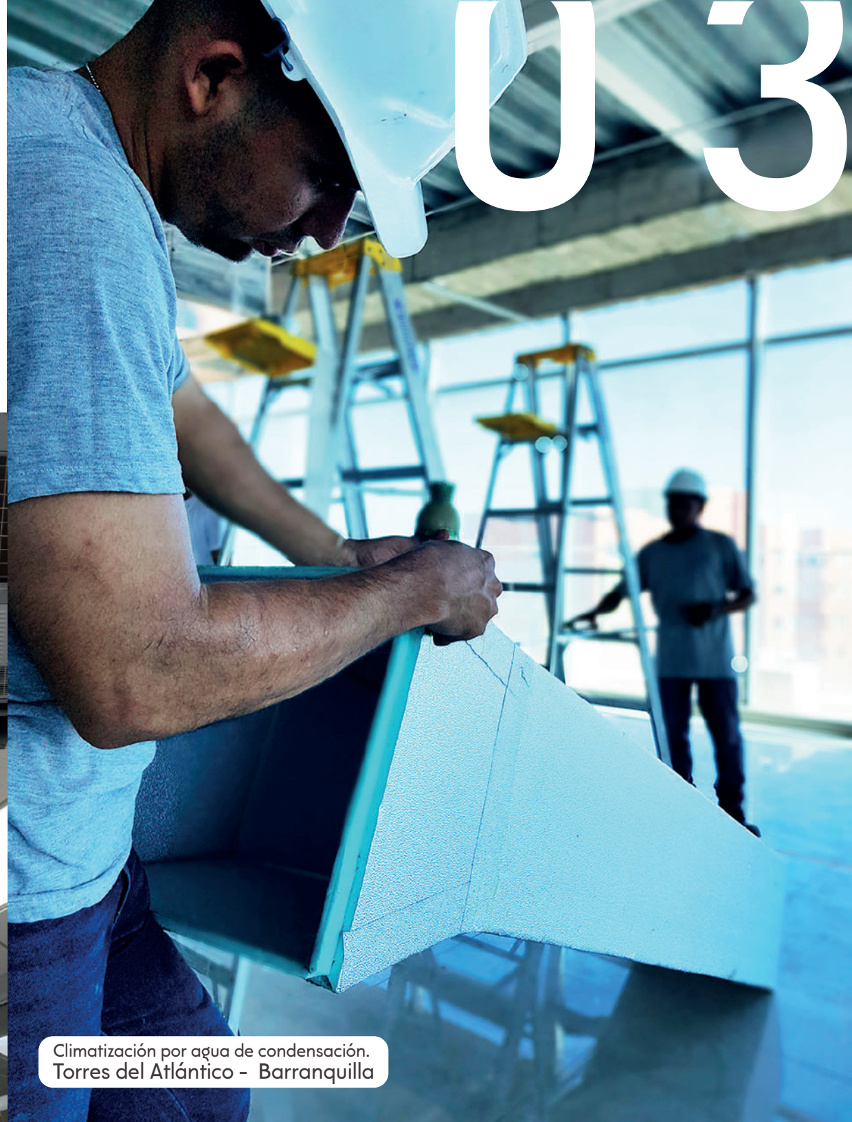
Climatización por agua de condensación. Torres del Atlántico - Barranquilla