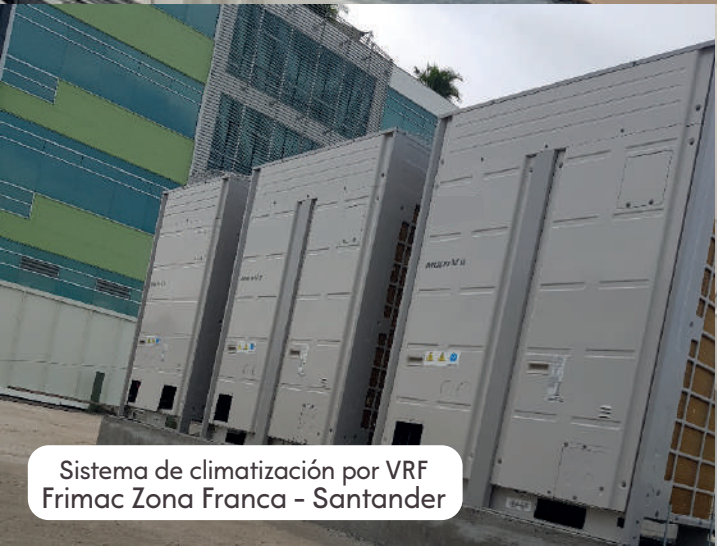
Sistema de climatización por VRF Frimac Zona Franca - Santander