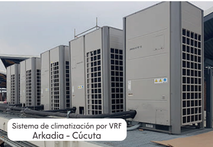
Sistema de climatización por VRF Arkadia - Cúcuta